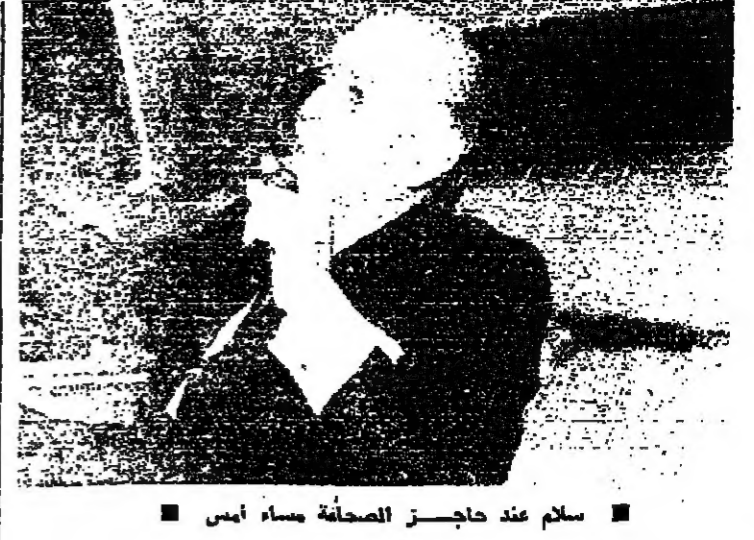
سلام عند حاجز الصحافة مساء أمس